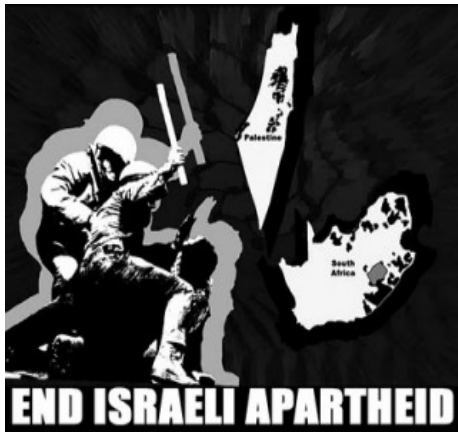
Slika 6: vir:

Desmond je v enem od intervjujev povedal, da nikoli ne dvomi v Boga, vendar je večkrat jezen nanj, saj ne razume, zakaj dovoli, da se dogaja toliko krivic. V svojem