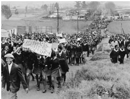
Slika 2: vir:

Zaradi svoje predanosti pastoralnemu poklicu in prijateljev (cerkvenih dostojanstvenikov), ki so želeli temnopolte sodelavce v cerkvi, je hitro napredoval. Že leto po delovanju kot dekan je bil nominiran za škofa Lesotha, a je najprej vljudno zavrnil, ker se z ženo nista želela znova seliti. Prijatelji so jima svetovali, da bi bila zavrnitev takšnega položaja v očeh javnosti lahko arogantna. Tako je med 1976 in 1978 Tutu škofoval v Lesothu in delal kot generalni tajnik Južnoafriškega cerkvenega koncila. Pri delu v koncilu je prvič pokazal svojo kontraverznost, ki v cerkvenih krogih ni bila dobrodošla kljub splošni podpori cerkve za odpravo apartheida. Podoben diskurz je obdržal tudi v svojem političnem življenju.