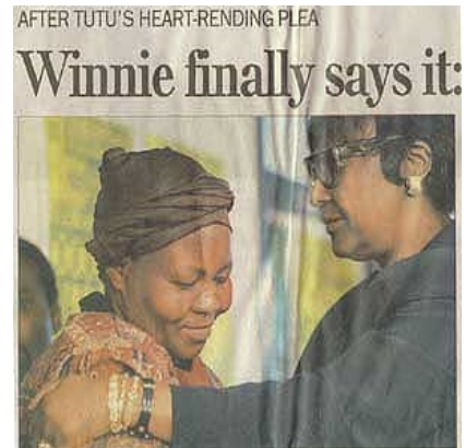
Slika 5

Po izvolitvi je predsednik Mandela vzpostavil Komisijo za resnico in spravo, ki ji je po njegovi želji predsedoval nadškof Tutu. Sledili so zgledu Čila, Argentine in Ugande, da bi zagotovili pravico vsem prizadetim, vendar so naredili korak naprej. Vsi pripovedovalci so svojo zgodbo namreč povedali v prisotnosti kamer. Javna zaslišanja vseh vpletenih je tako v grozi spremljala vsa država. Zločini v zameno za pripoved resnice preživelim niso bili sodno preganjani. Kdor ni želel sodelovati, je bil zaradi suma