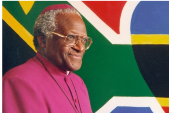
Slika 4:

Kljub temu da so že leta 1833 odpravili suženjstvo, se je zatiranje temnopoltih nadaljevalo do padca apartheida leta 1990. Takrat so ljudje končno sprejeli Tutujevo teološko ubuntu filozofijo, ki pomeni človeškost in pravi, da človek postane človek šele v razmerju do sočloveka