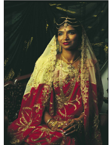
Slika 5

S kategorijo Indijcev se identificira 2,5% prebivalcev. Ta kategorija pravzaprav zajema vse južne in jugovzhodne Azije, večinoma potomce delavcev, ki jih je v 19. stoletju za delo na sladkornih plantažah pripeljala Nizozemska Vzhodnoindijska družba. Plantaže so bile najpomembnejši sektor kolonialne ekonomije, vendar so delovno silo morali pripeljati od drugod, saj med Zuluji zaradi lastništva zemlje interesa za delo na plantažah ni bilo. Danes se večina azijskih Južnoafričanov preživlja s podjetništvom in trgovino.