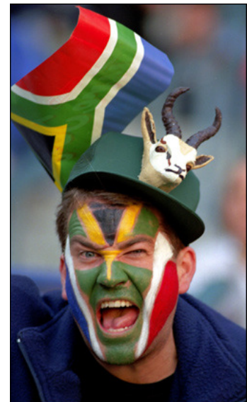
Slika 4 (vir:

Danes se na cenzusu posamezniki sami odločijo v katero kategorijo spadajo. S kategorijo belcev se identificira 9,6% prebivalcev, ki so večinoma potomci kolonialnih imigrantov iz Nizozemske, Nemčije, Britanije ter francoskih Hugenotov. Ti so v JAR prihajali od 16. stoletja dalje in se lingvistično delijo v dve skupini – angleško in afrikaansko govoreče. Čeprav je v javnosti načeloma dovoljena raba kateregakoli izmed enajstih uradnih jezikov in mora na državnih uradih vsak imeti možnost uporabljati katerikoli jezik želi, se na univerzah, v politiki, poslovanju in medijih največ uporablja angleščina. Posamezni afriški jeziki so v rabi le v nižjih razredih osnovne šole, tudi kjer so vsi učenci iz iste etnične