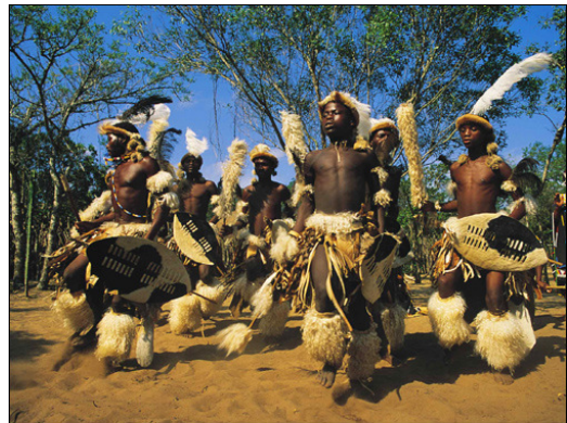
Slika 7 Ples v čast Shaka Zulu (vir:

praznikov »dan tradicije«, ki temelji na