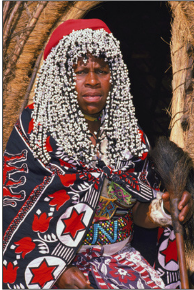
Slika 8 Predstavnica skupine Zulu