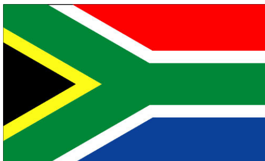
Slika 1: Zastava

Skoraj 50-milijonski »mavrični narod«, kot je ob koncu apartheida 1994 Južnoafričane poimenoval nadškof Desmond Tutu, je uradno razdeljen na štiri kategorije – belce, »obarvane« ( Coloured ), temnopolte (oziroma po letu 1994 Afričane) in Indijce. Državna politika si od konca apartheida kljub veliki