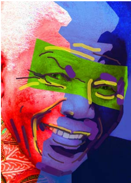
Figure 4 Nelson Mandela v podobi moderne plemenske umetnosti

Danes je Robben Island Prison turistična destinacija, ki si jo vsako leto ogleda več tisoč turistov. Svoj sloves je bolj kot zaradi strahotnosti kraja zaslužil, ker je poznan kot dolgoletni »dom« Nelsona Mandele. In če preštejemo mostove, vrtove in spomenike, ki nosijo Mandelino ime bi lahko rekli, da se vse česar se dotakne spremeni v zlato in niti zaporniška celica ni izjema. Njegova tragična zgodba, ki skriva veliko veselja, upanja in osebne moči, je zaznamovala prejšnje stoletje na vseh področjih. Predstavlja dobro in slabo na temu svetu in v eni zgodbi združi črno in belo.