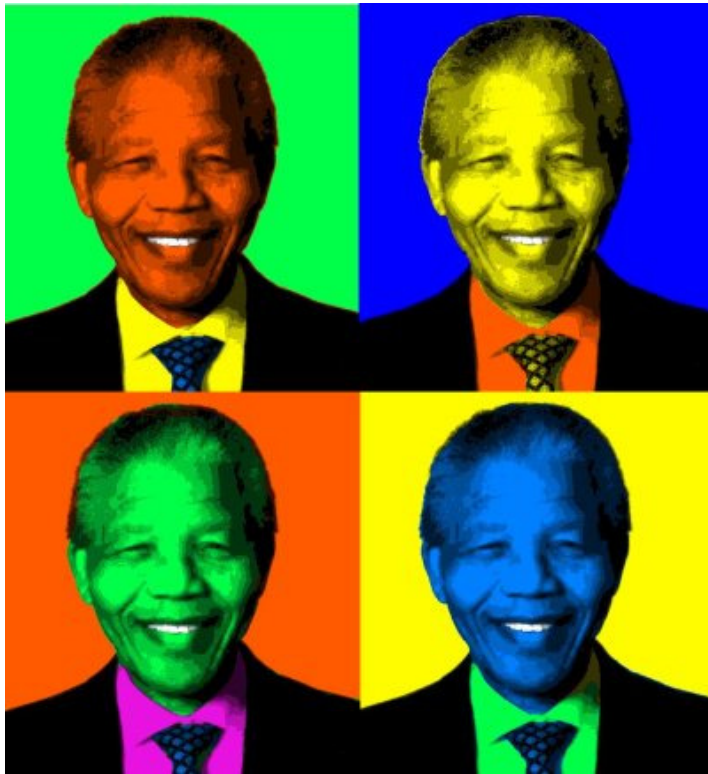
Figure 1, Nelson Mandela v Popart podobi

Izredno ceni tudi glasbo. Ne samo evropsko klasično glasbo, v kateri najraje uživa, temveč tudi afriško zborovsko glasbo in različne žanre, ki vplivajo na okolje v katerem deluje. Če pa bi moral vseeno izbrati le eno ime, le en glas, bi njegova izbira bila Paul Robeson.