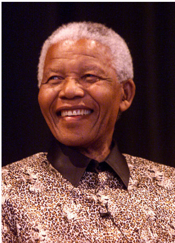
Slika 1 Nelson Mandela v tradicionalni noši

Žal v današnjem času svetovni vodje ne premorejo izčiščene politične misli in vodstvenih sposobnosti, kot jih je premogel Nelson Mandela. Njihovi osebni apetiti so postavljeni pred ljudi, ki jim vladajo. In v teh časih njegova zvezda sije še bolj močno in sveti na pot veličine in modrost.