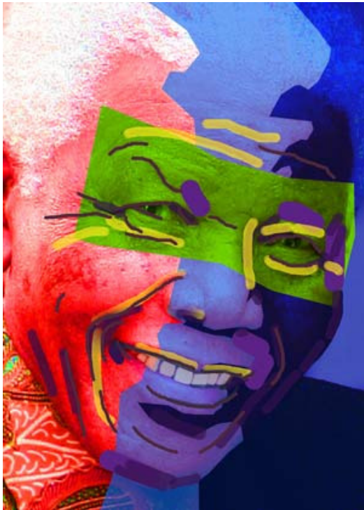
Figure 4 Nelson Mandela v podobi moderne plemenske umetnosti

Danes je Robben Island Prison turistična destinacija, ki si jo vsako leto ogleda več tisoč turistov. Svoj sloves je bolj kot zaradi strahotnosti kraja zaslužil, ker je poznan kot dolgoletni »dom« Nelsona Mandele. In če preštejemo mostove, vrtove in spomenike, ki nosijo Mandelino ime bi lahko rekli, da se vse česar se dotakne spremeni v zlato in niti zaporniška celica ni izjema. Njegova tragična zgodba, ki skriva veliko veselja, upanja in osebne moči, je zaznamovala prejšnje stoletje na vseh področjih. Predstavlja dobro in slabo na temu svetu in v eni zgodbi združi črno in belo.