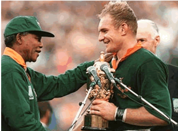
Figure 2 Nelson Mandela čestita Francoisu Pienarju

Njegov lik se pojavi v preko ducat filmih in celo v humoristični risani seriji American dad , kjer se pogosto šalijo iz slavnih osebnosti. Nelsona Mandelo so si privoščili na račun podobnosti z igralcem Morganom Freemanom, ki ga je upodobil v filmu Nepremagljiv .