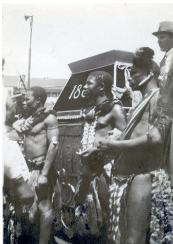
Ob rudnikih zlata

( www.afromix.org...kwaito-hits.en.html , pregledano aprila 2010)