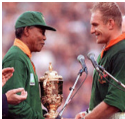
Foto 1: Francois Pienaar na svetovnem ragbi tekmovanju leta 1995 prejme pokal iz rok Nelsona Mandele.

Ragbi je v JAR eden najpopularnejših športov med belim in mešanim prebivalstvom v JAR. Predstavlja 20 procentov populacije, ki se z njim ukvarjajo in državi prinaša ogromno bogastvo. Zagotovo je, da biti svetovni prvak v ragbiju ni enako zaznamovano kot v FIFA svetovnem nogometnem prvenstvu, saj je že število držav, ki med seboj tekmujejo, manjše. Vseeno moramo razumeti, da si zaradi statusa, ki ga ima južnoafriški ragbi v svetu, z že tako najštevilčnejšim temnopoltim prebivalstvom, pridobiva vse večjo množico le-teh, kljub temu, da