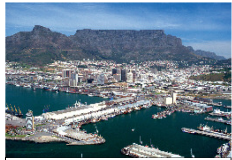
Foto 3: Mizasta gora.

Kadar obiščemo Cape Town, naj ne zanemarimo vzpona na Mizasto goro, ki mu daje značilno panoramsko podobo in je visoka komaj 1088m. Njene stene ponoči celo osvetljujejo z žarometi. Skoraj popolnoma ravna vršna planota, dolga okoli 3 kilometre, se na južno stran prevesi v do 400 metrov visoke stene, na severu pa se spušča v